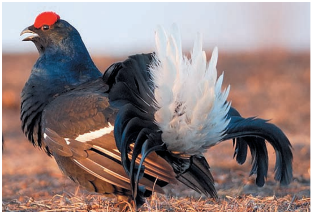
Тетерев-кочкач. А брови у него очень красивые!